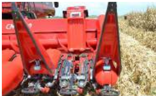
Sistema de anclaje de capota a resortes. Permite disminuir tiempos de trabajo de limpieza y mantenimiento de cadenas alzadoras.