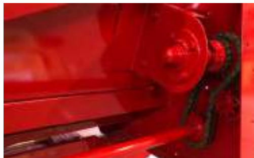
Transmisión de sinfín independiente de eje de mando de caja.