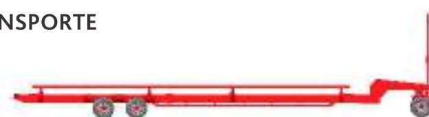
En cabezales de 14 a 18: Carro de transporte con doble eje en tándem trasero y avant tren.