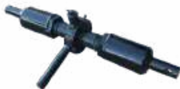
Estandar: Sistema mecánico.