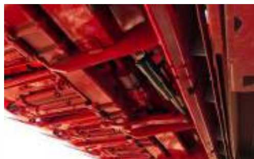
Opcional: Sistema hidráulico.