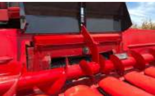
Adaptable a cualquier cosechadora nacional o importada.