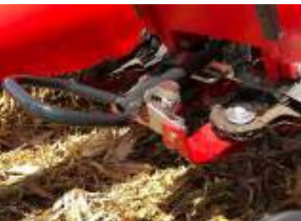
Sistema de regulación de altura de puntones punto por punto.