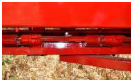
Zafes individuales por cuerpo. Evitan roturas de cajas al momento de un atascamiento.