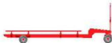
En cabezales de 8 a 13 surcos Carro de transporte con doble eje y avant tren.